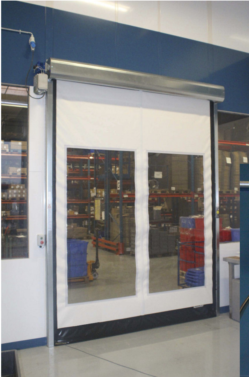
porte souple : option capot traverse et grande visibilité